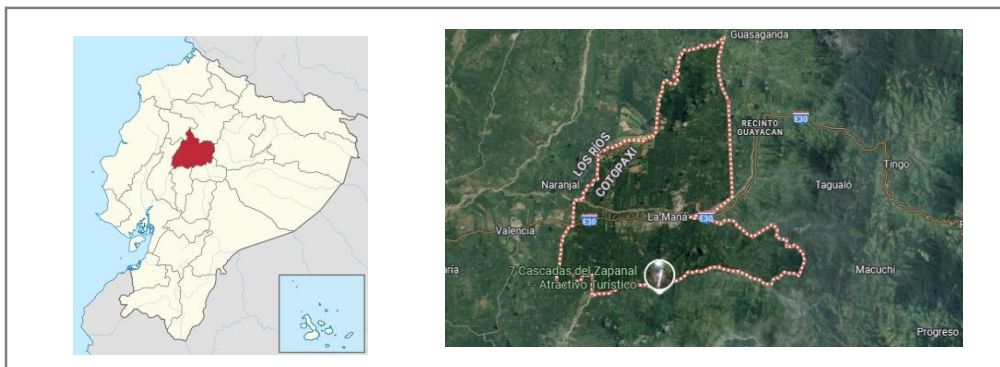
Figura 1. Ubicación situacional del cantón La Maná.