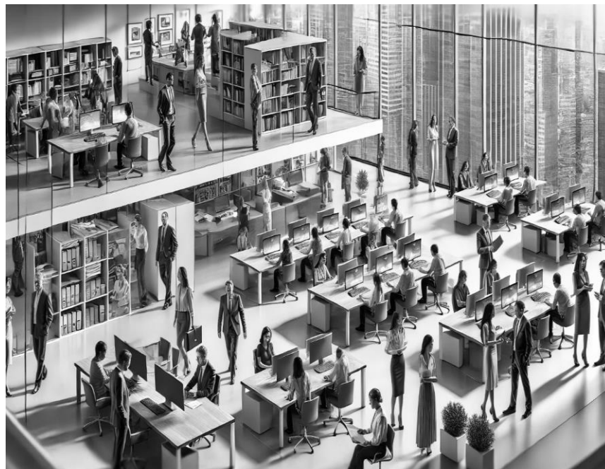
Figura 1. Empleados corporativos.

La población objeto de estudio está conformada por empleados de distintas empresas del sector corporativo, abarcando organizaciones de diversos tamaños y sectores. La muestra se determinará mediante un muestreo probabilístico estratificado, segmentando a los participantes según su nivel jerárquico dentro de la empresa. Se espera obtener una muestra representativa de aproximadamente 200 empleados distribuidos en cargos operativos, administrativos y directivos.