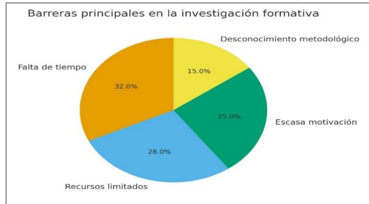
Figura 3. Barreras principales en la investigación formativa.

Los estudiantes identifican cuatro obstáculos principales que afectan la investigación formativa: falta de tiempo (32%), limitación de recursos (28%), escasa motivación (25%) y desconocimiento metodológico (15%). Estos factores reflejan tanto carencias estructurales como limitaciones individuales, y constituyen elementos críticos que deben ser abordados desde la planificación institucional para garantizar un proceso investigativo sostenible y con impacto en la calidad educativa.