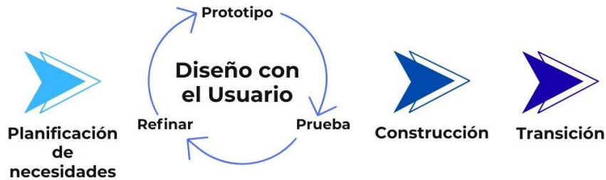
Figura 1. Fases de la metodología RAD Desarrollo Rápido de Aplicación.

usuarios para mejorar gradualmente el sistema (Singgalen, 2024). El proceso de la metodología RAD está detallado a continuación, la figura 1 ilustra el flujo de esta metodología.