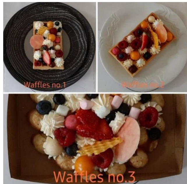
Figura 3. Condición visual de los alimentos.

La Figura 3 del estudio de Berčík, Paluchová, Neomániová (2021) indica que los sentimientos más positivos en términos de probar las presentaciones visuales fueron waffles en un plato blanco clásico (Waffles 2) con un valor de puntuación de -0.02 , que puede considerarse una respuesta neutral. Esto puede deberse al hecho de que los encuestados no consideraron que la comida fuera demasiado cara y, al mismo tiempo, demasiado barata por la forma en la que estaba emplatado. Además, en términos de atención visual, este emplatado los atrajo más. Por el contrario, con base en un promedio de -0.08 , los encuestados calificaron la presentación de comida callejera (Waffles 3) como la más negativa. En la evaluación general de las representaciones visuales individuales disponiéndolas en orden, los encuestados mencionaron con mayor frecuencia mayor aceptabilidad de los waffles preparados en un lujoso plato negro en primer lugar (64 %). Por el contrario, la mayoría de los encuestados mencionaron los waffles estilo comida callejera en tercer lugar (54%). En el caso