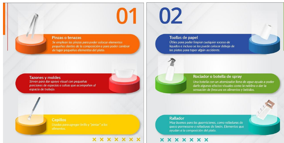
Figura 1. Herramientas usadas en food styling.

Gonzales y Padilla (2021) en un estudio sobre los productos de una panadería buscó mejorar la predisposición de compra a través de un cambio en el manejo de la publicidad digital en Instagram que maneja la empresa. Se usa la propuesta de food styling como recurso para optimizar visualmente 5 productos que ofrece la panadería. Según Moran y Madero (2016), la fotografía de alimentos logra llamar y captar el interés y atención del consumidor para luego aumentar su deseo de compra y finalmente realizar la acción de consumir. La fotografía logra beneficiar a una empresa debido a que se logra crear una imagen del producto dentro de la mente del consumidor, creando así recordación de marca.