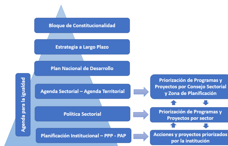
Figura 1.- Guía de Planificación Institucional.